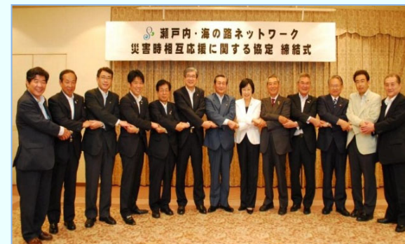
平成24年6月1日海ネット協定締結式