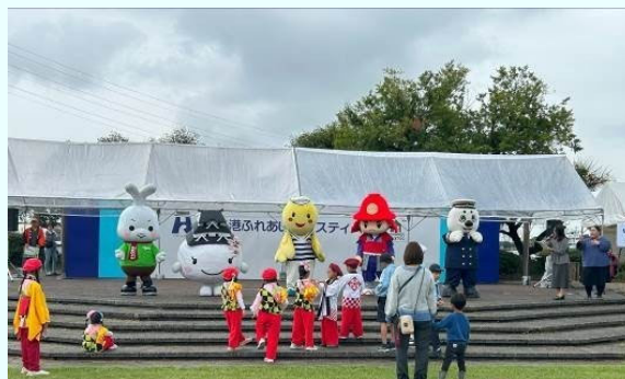
令和7年度「姫路港ふれあいフェスティバル」(姫路市)

瀬戸内海地域の地域振興を進めていくために、みなを中心としたイベント・活動等を支援。