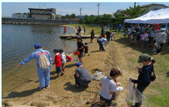
令和7年度「リフレッシュ瀬戸内」(高石市)

平成5年度より、海浜清掃活動を実施。これまで(H5d～R7d)、延べ約214万人が参加、約19,792トンのゴミを回収。