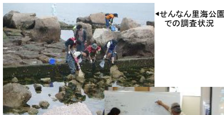
せんなん里海公園での調査状況