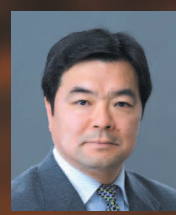
高橋 進 株式会社日本総合研究所 理事長 経済財政諮問会議 議員

主催/(公社)関西経済連合会、国土交通省近畿地方整備局 後援/国際物流戦略チーム