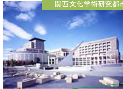
関西文化学術研究都市