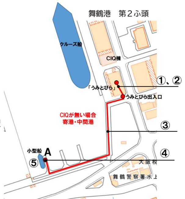
・地理院地図（電子国土 Web）を加工して作成

※「うみとびら」内の施設配置、「うみとびら」から小型船が接岸する棧橋までの旅客動線並びに設備を確認し、効率性・利便性・安全性での課題を把握します。