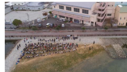
小学生への「あつまれ生き物の浜」お披露目会