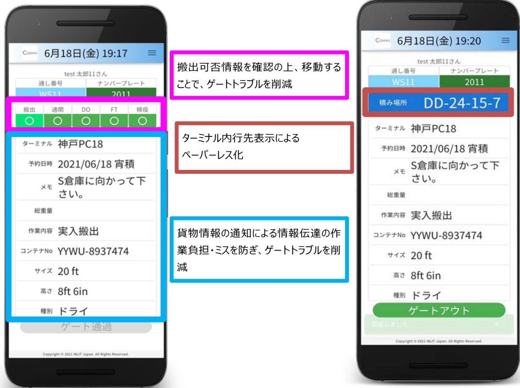
配車指示の受付後に貨物状態を確認する画面