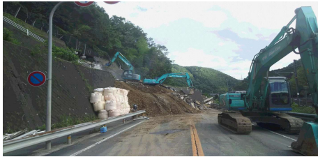
写真－1 建設会社による復旧状況

認定を受けられますと、当該建設会社は「災害時の事業継続力を備えている会社」として、信頼性や社会的評価の一層の向上が図られますことから、建設会社等は事業継続計画（BCP）策定に取り組んでいただき、大規模自然災害発生時に成果が発揮されることを期待しております。