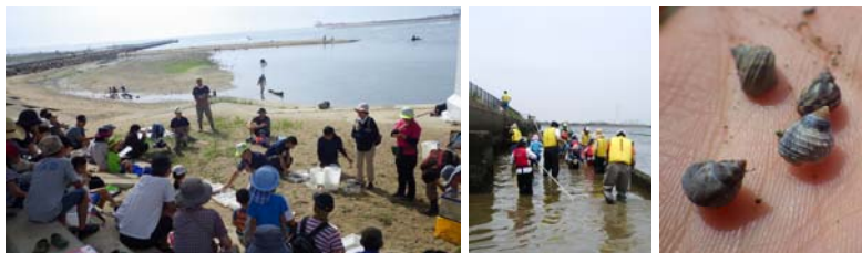
【参考：これまでの調査状況】