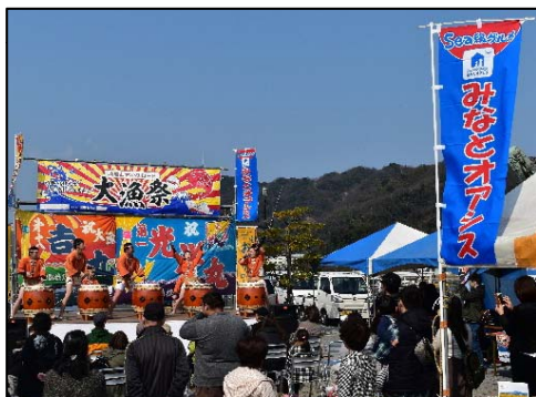
「みなとオアシス」における地域振興イベント