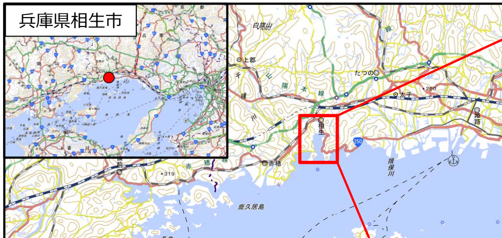
国土地理院地図（電子国土Web）( http://maps.gsi.go.jp )をもとに国土交通省作成