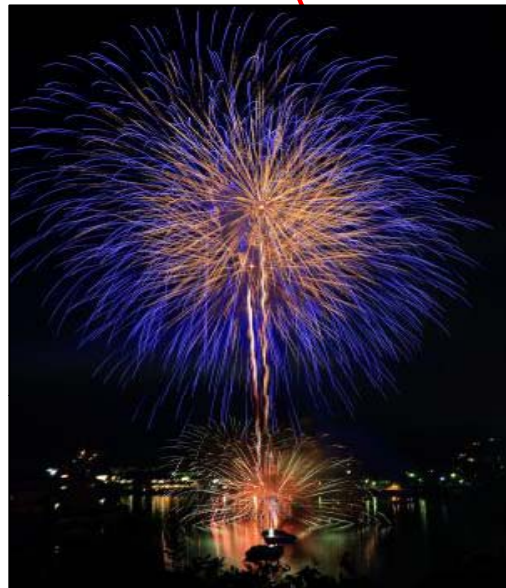
花火大会 (相生ペーロン祭前夜祭)