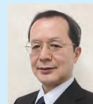
■国際港湾協会(IAPH) 副会長 篠原 正治