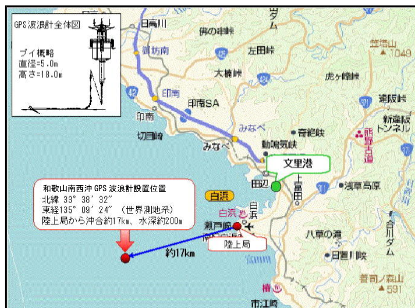
和歌山南西沖GPS波浪計設置位置図