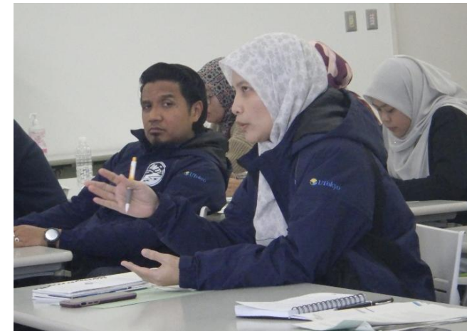
近畿圏臨海防災センターの概要説明および質疑応答