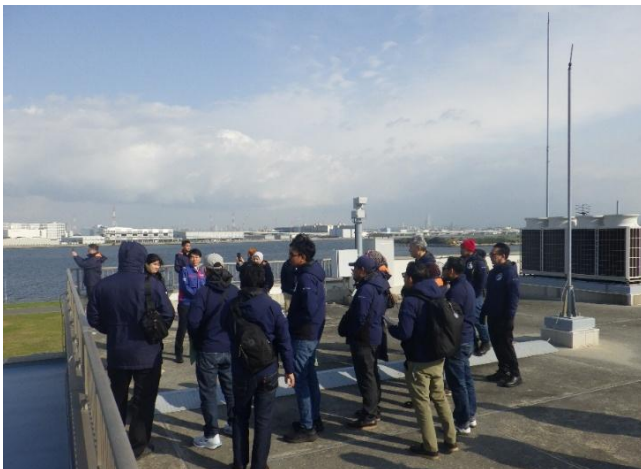
屋上から防災拠点を説明