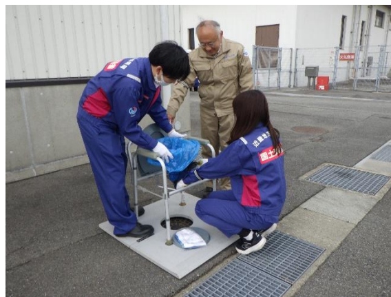
マンホールトイレ設置訓練