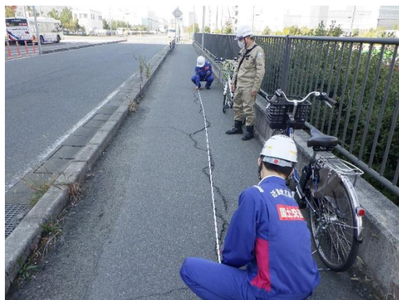
道路被災状況調査