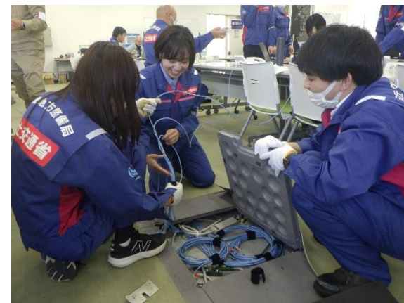
ネットワーク接続