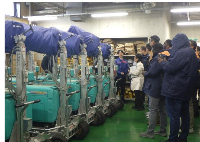
防災備品・資機材 説明