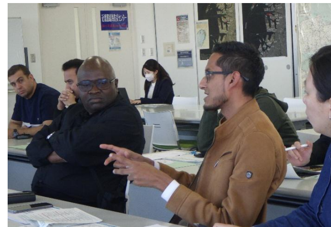
近畿圏臨海防災センターの概要説明および質疑応答