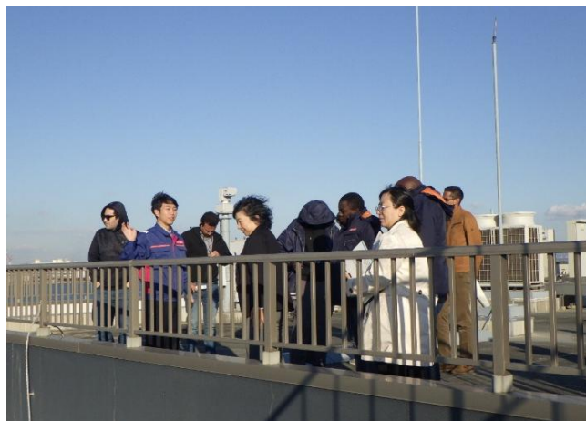
屋上から防災拠点を説明