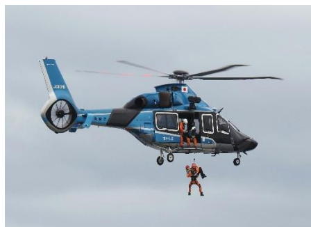
大阪府警ヘリ「まいしま」による救出