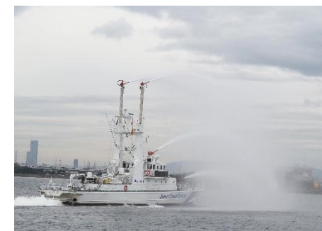
海保巡視艇「みのお」による火災危険排除