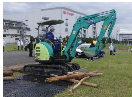
バックホウによる道路啓開