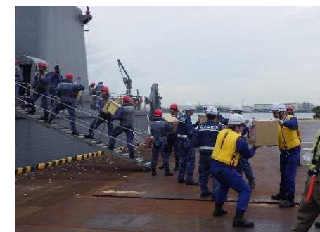
堺浜第1号岸壁における緊急物資輸送