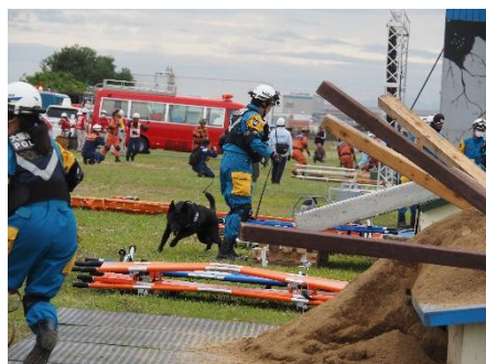
警察犬によ要救助者の検索