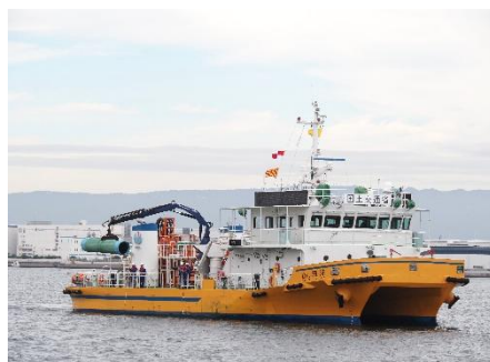
近畿地整船舶「Dr. 海洋」による航路啓開