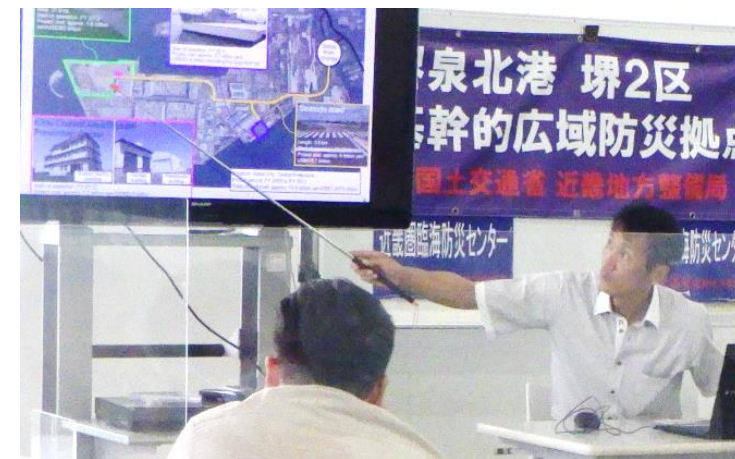
講義「近畿の港湾における災害対策」・講義「堺泉北 堺2区基幹的広域防災拠点の概要」