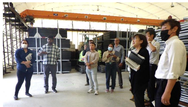
資機材説明(倉庫棟)