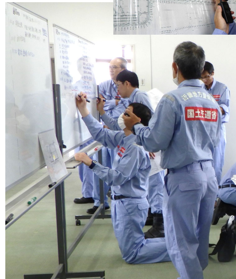
各隊から逐次報告される情報を整理