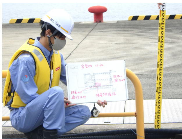
被災況調査(岸壁部)