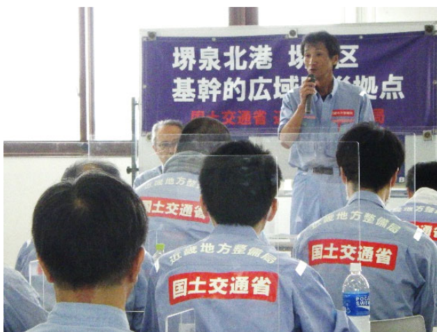
訓練実施内容の説明

※ 災害対策チーム: 港湾空港部職員で構成。防災拠点で初動対応を担うチーム(令和5年度45名)