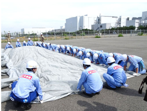
エアーテント展張訓練