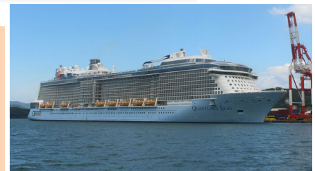
クァンタム・オブ・ザ・シーズ2019年8月13日初入港 総トン数:168,666トン 乗客定員:4,180名