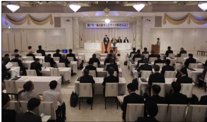
平成30年度総会の様子