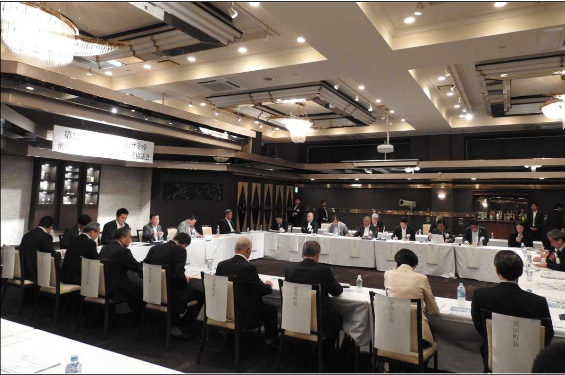
第12回瀬戸内海首長サミットの様子

○「瀬戸内海の魅力を磨くには」をテーマに参加首長(20名)により議論がなされ、最後にコーディネーターである四国地方整備局次長より「それぞれの本物を大事にして、各地の魅力をネットワークでつなぎ、点が線になるような取り組みを行っていきましょう。」ととりまとめられました。