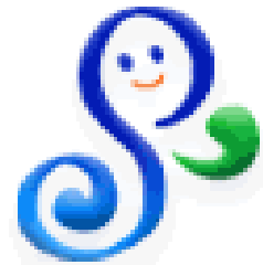
海ネットのシンボルマーク