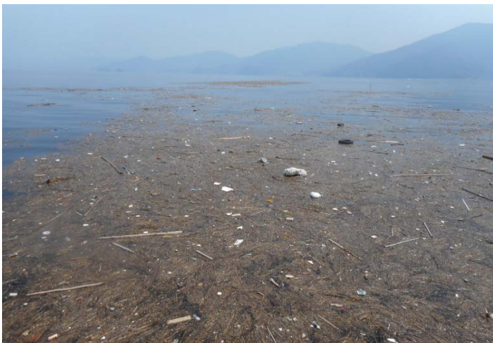
回収前(漂流物)状況

全長 33.50m 全幅 11.6m 総トン数 196トン 近畿地方整備局 神戸港湾事務所所属