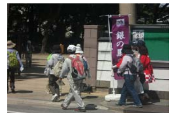
銀の馬車道ウォーク

姫路みなとミュージアム、飾万津臨港公園、姫路みなとドーム、姫路港旅客船ターミナルを「みなとオアシス姫路」として登録