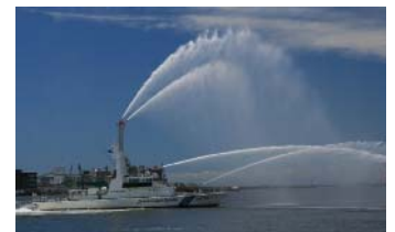
海上保安部巡視艇放水展示