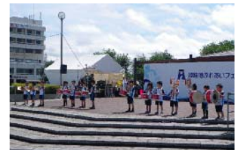
ふれあいポートステージ