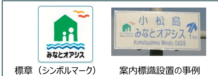
標章（シンボルマーク）