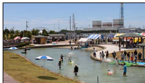
Sioトープ子どもまつり