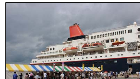
大型客船「にっぽん丸」寄港