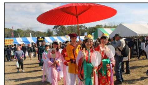
宮子姫みなとフェスタ