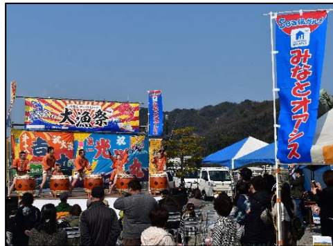
「みなとオアシス」における地域振興イベント