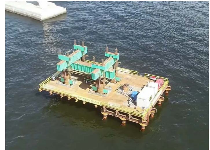
▲ドローン映像イメージ