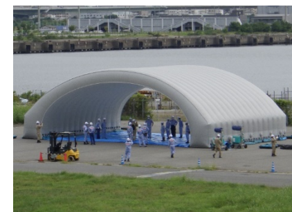
支援物資受入準備訓練 (エアテント展張)