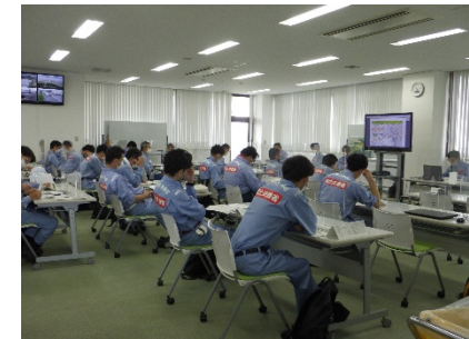
対策チームの役割・活動説明