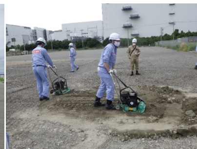
応急復旧訓練 (プレートコンパクター整地)