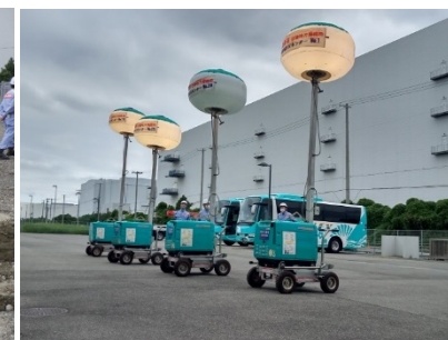
支援物資受入準備訓練 (投光器設置)