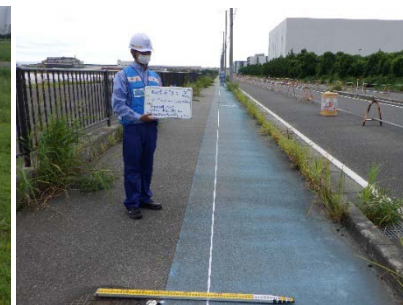
被災状況調査 (臨港道路のクラック計測)