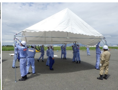
支援物資受入準備訓練 (小型テント設置)