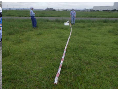
被災状況調査 (緑地のクラック計測)