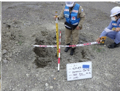
被災状況調査 (緑地の陥没箇所計測)