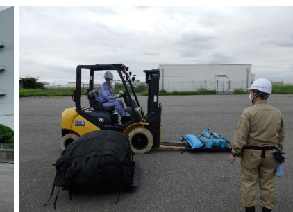
機械器具操作習熟訓練 (フォークリフト運搬)