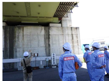
被災状況調査 (道路橋脚部の変位等計測)