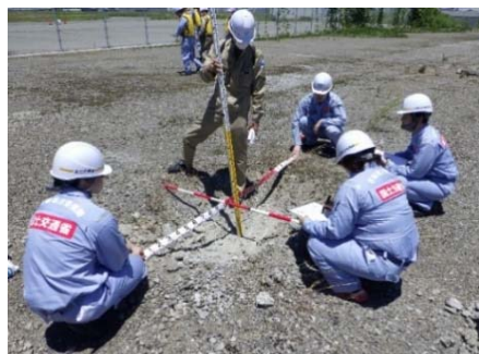
被災状況調査 (緑地の陥没箇所計測)