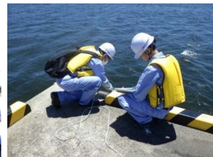
被災状況調査 (岸壁部の変位等計測)