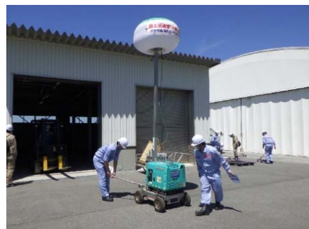
支援物資受入準備訓練 (投光器設置)