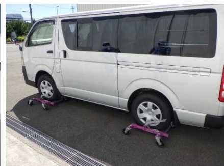
道路啓開訓練 (リフターによる車両移動)