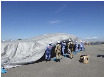
支援物資受入準備訓練 (エアテント展張)