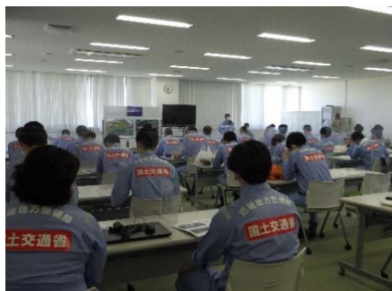
訓練想定・訓練内容等説明