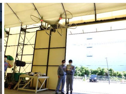
ドローン操縦訓練