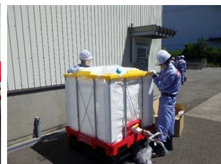
給水タンク設置訓練