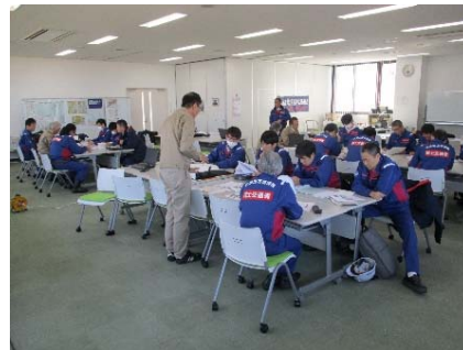
出動前の班別ミーティング