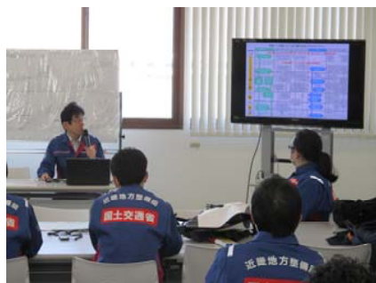
防災センター長からの訓練想定説明