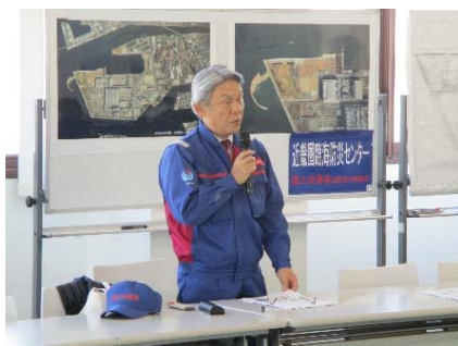
現場統括責任者(事業計画官)からの各班展開指示