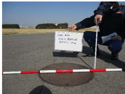
緑地内道路の液状化確認 (事務班B)