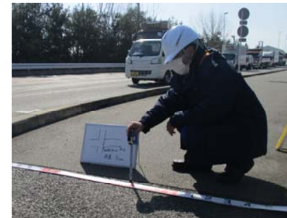
臨港道路接合部の段差確認 (対策班：道路)