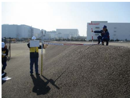
護岸背後の陥没確認 (事務班A)