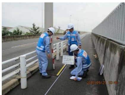
道路上の照明灯の傾斜確認 (対策班：道路)