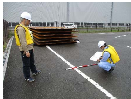
岸壁背後地の液状化調査 (対策班：岸壁)