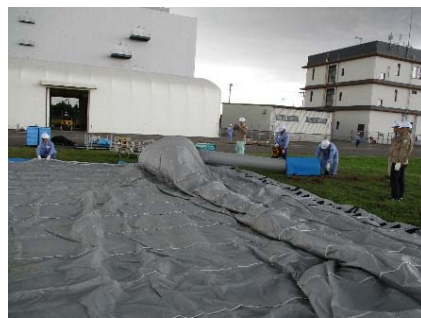
エアテントの展張訓練 (対策班：緑地)