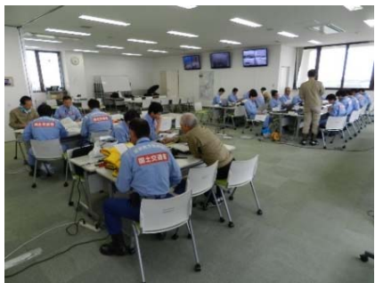
調査出動前班別ミーティング