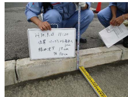
緑地内歩道部分の沈下確認 (情報収集班・調達班)