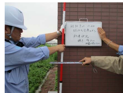
緑地内トイレの倒壊状況確認 (情報収集班・調達班)