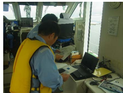
ナローマルチソナーによる 深淺測量訓練 (対策班：岸壁)