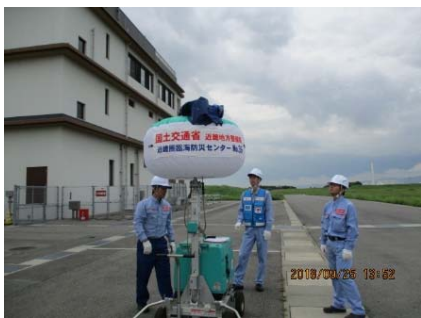
投光器付発電機の作動確認 (対策班：道路)