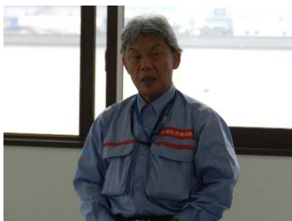
現場統括責任者(事業計画官)からの各班展開指示