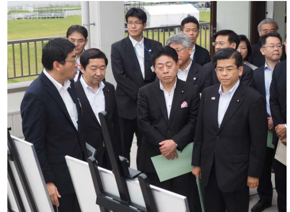
支援施設棟から防災拠点をご覧になれる石井国土交通大臣