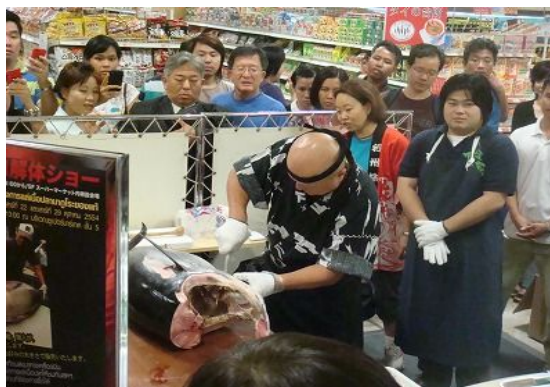
【マグロ解体ショーの様子】