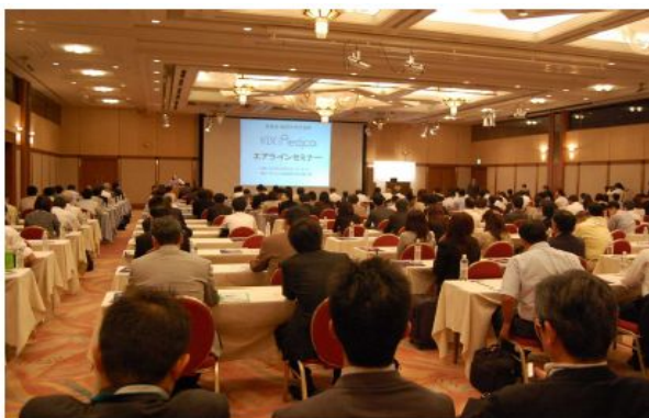
【医薬品セミナーの様子 (CKTS プレゼン)】