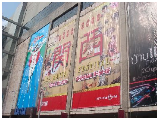
【広告・宣伝の様子】

また、タイ（バンコク）向けの近江牛、鮮魚、農産物等の輸出促進を行い、現地でのマーケティングを趣旨とした物産展への支援、広告・宣伝、集客イベント、観光 PR を行った。その結果、近江牛は現地日系百貨店での常設店舗の設置、鮮魚においては、各レストランへの継続取引が決定した。