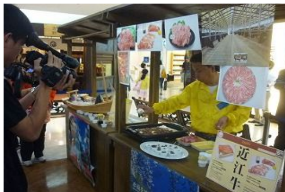
【近江牛試食販売の様子】

※その他、平成 21 年度は 7 事業、平成 22 年度は 5 事業を認定し成果をあげています。