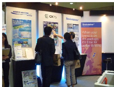
【2011年医薬品 EXPO 共同出展】